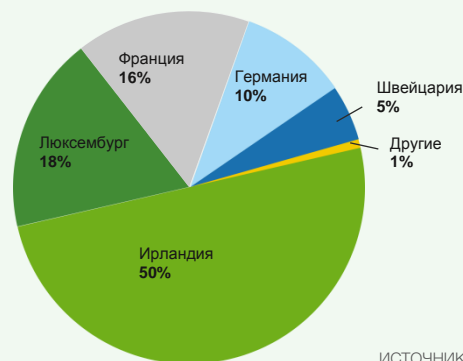
Резидентные активы ETF

Пятнадцать лет инновационных мероприятий и инициатив, а также наличие местных высокообразованных специалистов – это только некоторые из элементов, которые создают историю успеха Ирландии. Что касается ETF как самого захватывающего и наиболее динамично развивающегося сектора фондовой индустрии, Ирландия всегда на шаг впереди.